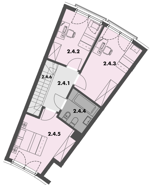
RZUT KONDYGNACJI 2